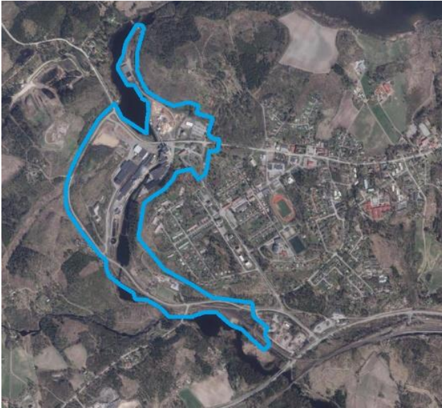
Kuva 1. Kaava-alueen likimääräinen raja esitettynä sinisellä viivalla.

Suunnittelualue sijaitsee Rautjärven kunnassa noin yhden kilometrin päässä Simpeleen keskustaajamasta itään. Alue on kooltaan noin 70 hehtaaria.