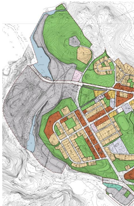
Kuva 3. ja 4. Otteet voimassa olevista osayleiskaavasta ja asemakaavasta